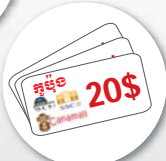
ទិញទំនិញនៅផ្សារទំនើប សាលាម៉ែល សុវិហា ឬសុវិន្យ