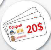
Canamall, Sorya and Sovanna Shopping Center